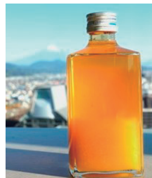
【こんたリキュール】 プレミアム金柑ブランド「こんた」を使用