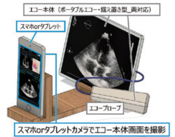
エコー実技教育AIシステム